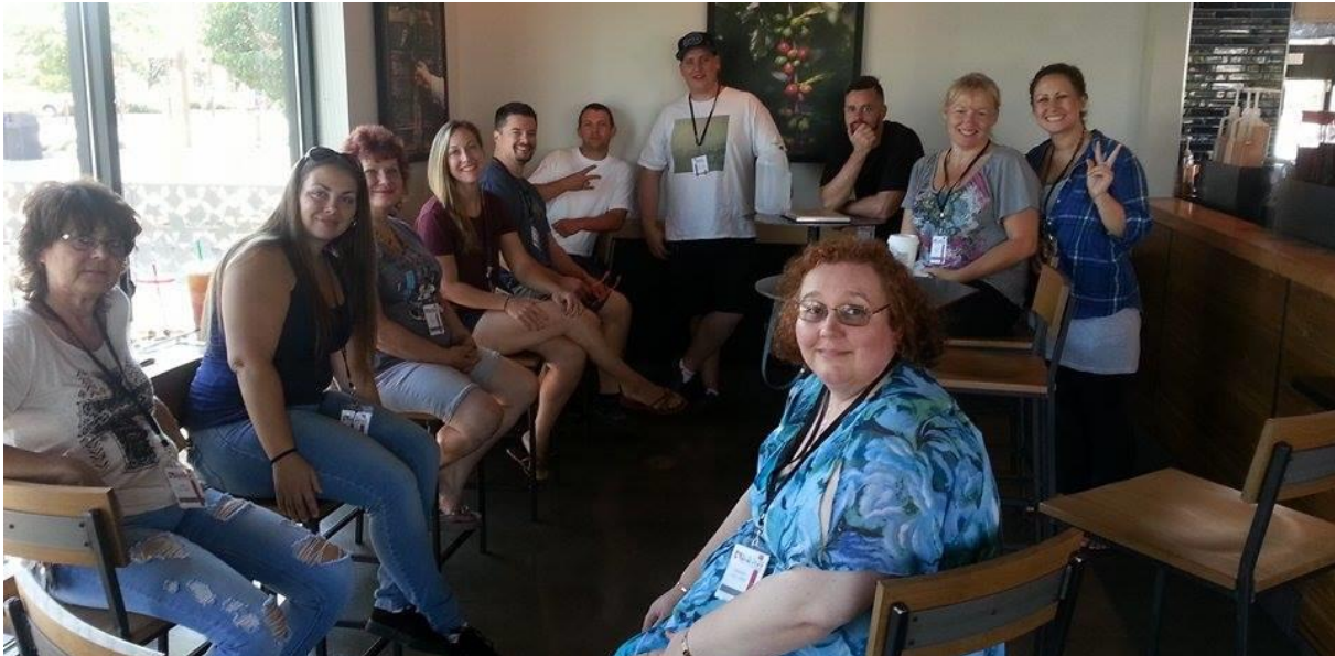
Ma classe des 6 mois derniers, 3 anglais, un frenchier (moi!), une canadienne, et les reste américains

J'ai revu aussi de la famille que je n'ai pas vu depuis 1997!