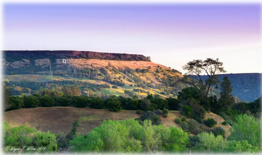
Ci-dessus, Table Mountain surplombant la ville d'Oroville (40 000 habitants)

Premièrement, je suis à Oroville en Californie du Nord (l'état est divisé en 2 Sud et Nord)