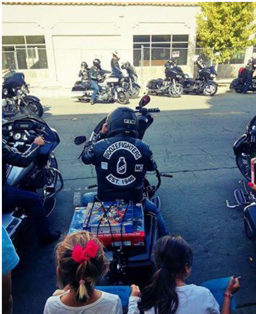
Fête foraine organisée par l'église, ici la venue de bikers apportant des cadeaux pour les enfants

J'aide aussi dans le centre de remise en forme qu'ils ont ouvert en 2013. C'est en plein centre ville et permet aux jeunes d'accéder au centre pour seulement 5 dollars par mois. Cela fonctionne comme un vrai centre de remise en forme professionnel. Et génère des revenus pour subventionner les personnes intégrant le programme de réhabilitation pour drogués.