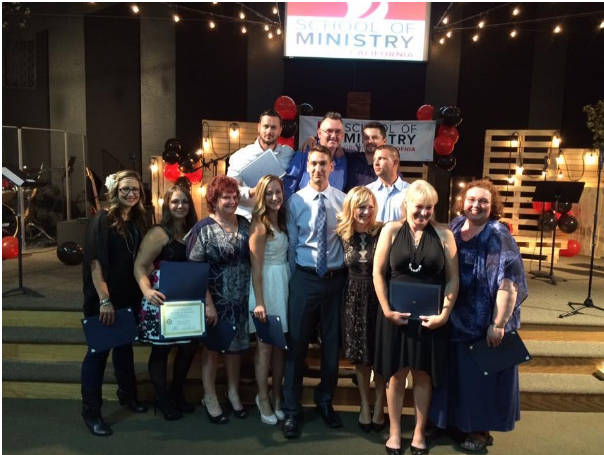
Le jour où on a reçu notre diplôme :) 1

L'église opère donc plusieurs business pour s'autofinancer. Ils ont un magasin de crème glacée (frozen yoghurt) qui marche très bien et de fripes de qualité. Tout l'argent va directement dans les ministères et à l'étranger où ils envoient de l'argent pour aider un ministère en Afrique qui permet aux petites filles de manger et de ne pas à avoir vendre leur corps pour de l'argent. L'argent aide aussi un ministère en Inde, une école opérée par des chrétiens auprès de castes démunies. Et ils aident une mission au Nicaragua.