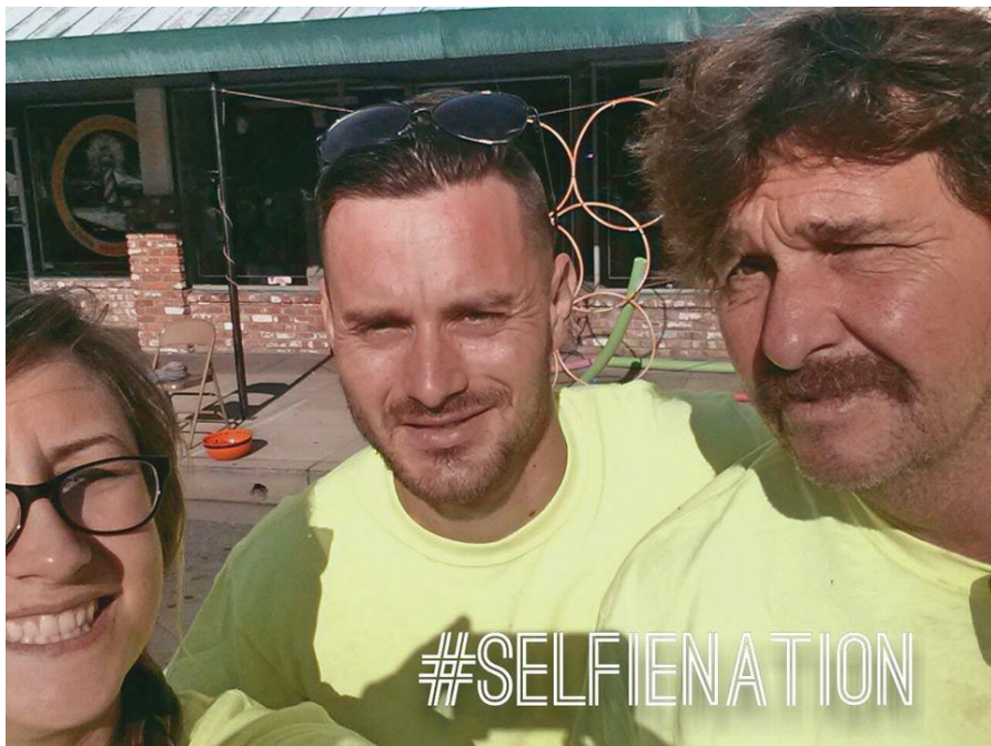
Fête foraine organisée par l'église avec mes coéquipiers

Oroville n'est pas une ville attirante, j'aurais jamais mis les pieds là si ce n'était Dieu qui y m'avait dirigé.