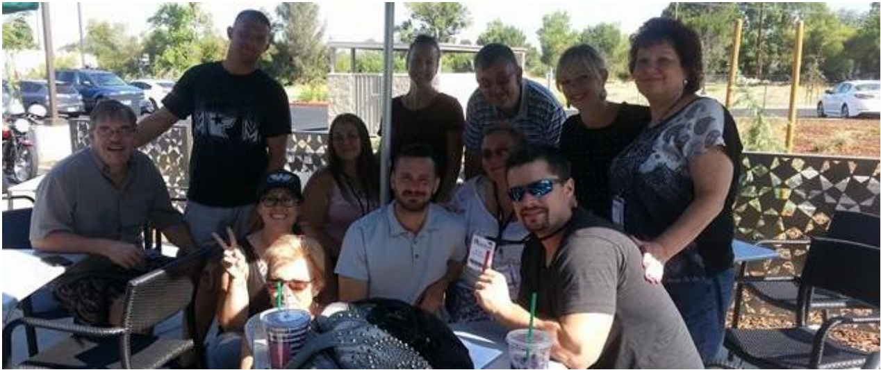
Une autre photo de classe

Pour l'instant j'aide tous les jours de la semaine dans divers départements. Je sers dans un centre de revente d'objets, meubles que les gens ne veulent plus. Je fais aussi des travaux divers et variés, travaux de jardinage entre autre :)